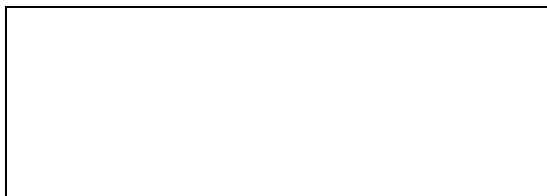
Схема границы балансовой принадлежности тепловых сетей

Прочие сведения по установлению границ раздела балансовой принадлежности тепловых сетей _____